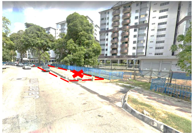
PANDANGAN SISI (KIRI)