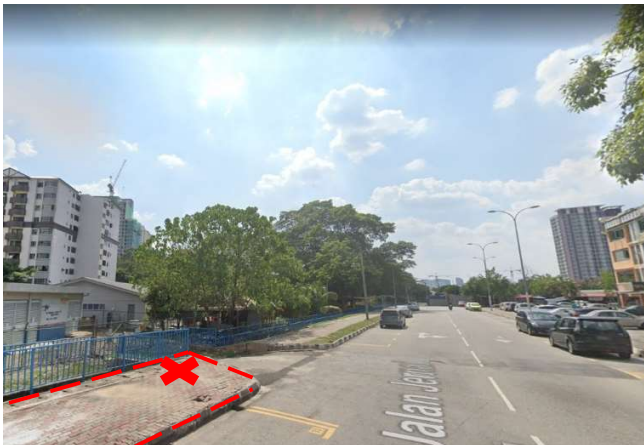
PANDANGAN SISI (KANAN)